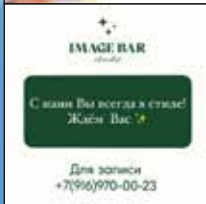
IMAGE BAR studio | С НАМИ ВЫ ВСЕГДА В СТИЛЕ!